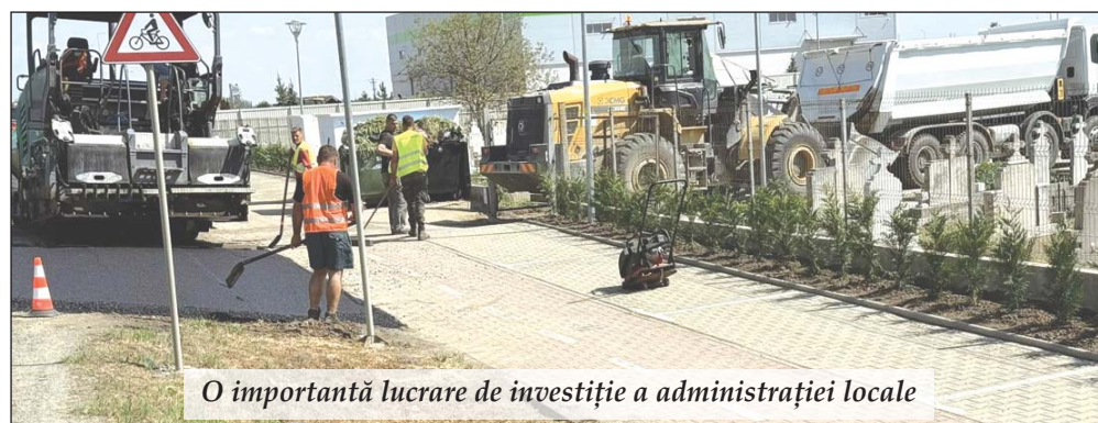
O importantă lucrare de investiție a administrației locale

Administrația locală continuă eforturile de modernizare și întreținere a zonelor cu însemnătate pentru comunitate. Recent, a fost finalizată amenajarea parcerii de la cimitirul din Vladimirescu, oferind astfel condiții civilizate celor care vin să își viziteze apropiații trecuți în neființă.