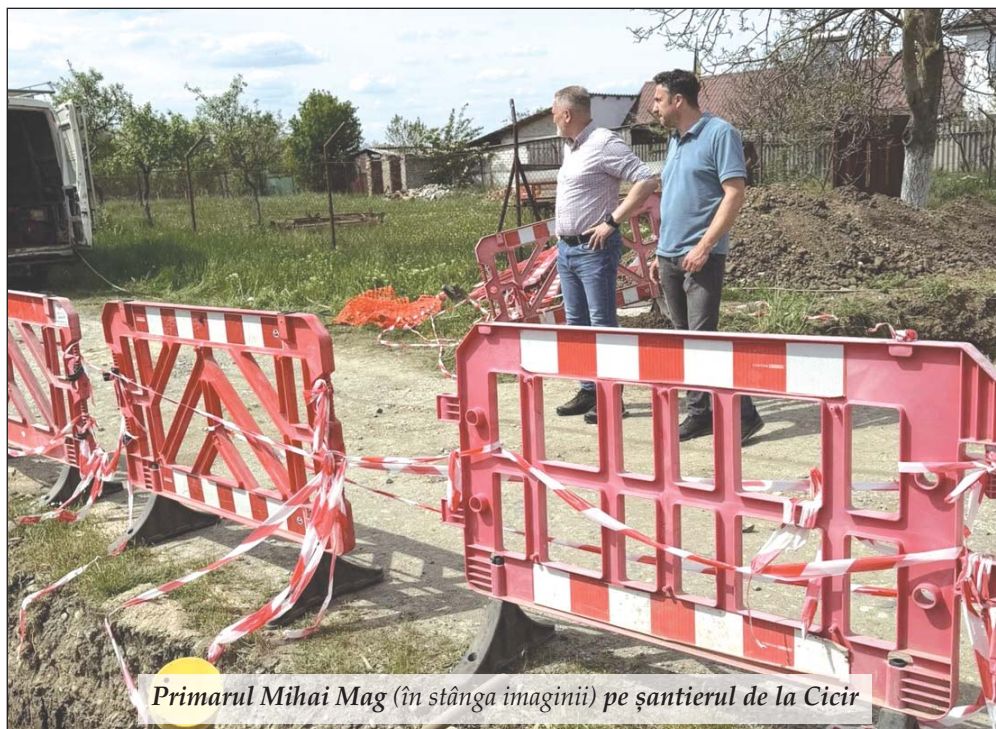
Primarul Mihai Mag (în stânga imaginii) pe șantierul de la Cicir

Noua etapă a lucrărilor confirmă angajamentul administrației locale pentru dezvoltarea coerentă și sustenabilă a acestui cartier. Fiecare utilitate adusă în teren înseamnă un pas înainte spre confort, într-un spațiu semiurban gândit modern.