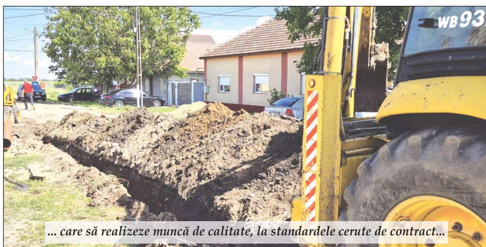
... care să realizeze muncă de calitate, la standardele cerute de contract...