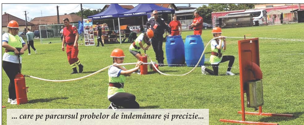
... care pe parcursul probelor de îndemânare și precizie...