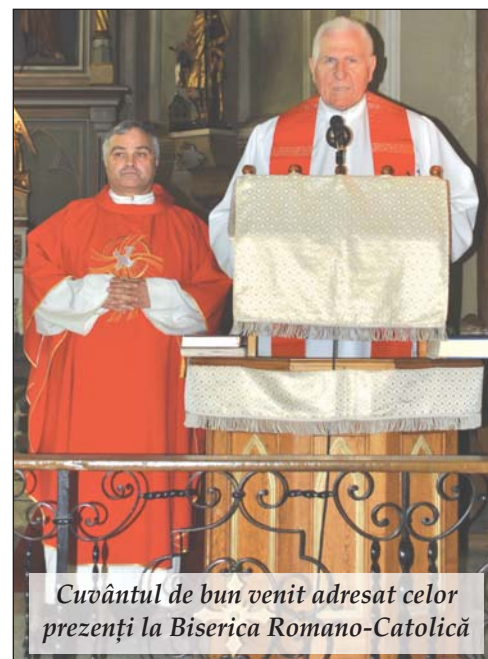
Cuvântul de bun venit adresat celor prezenți la Biserica Romano-Catolică

Gestul lor transmite un mesaj clar, în Vladimirescu, trecutul este respectat, iar cultura locală este promovată și onorată cu fiecare ocazie.