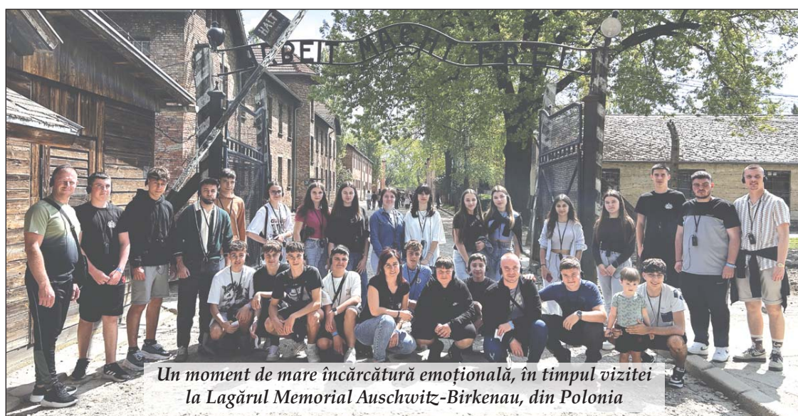
Un moment de mare încărcătură emoțională, în timpul vizitei la Lagărul Memorial Auschwitz-Birkenau, din Polonia

viziteze unele dintre cele mai importante locuri încărcate de istorie și cultură din Europa Centrală: lagărul memorial Auschwitz-Birkenau , un simbol dureros al memoriei colective, Varșovia (capitala Poloniei), dar și Praga , perla arhitecturală a Cehiei. Aceste vizite au