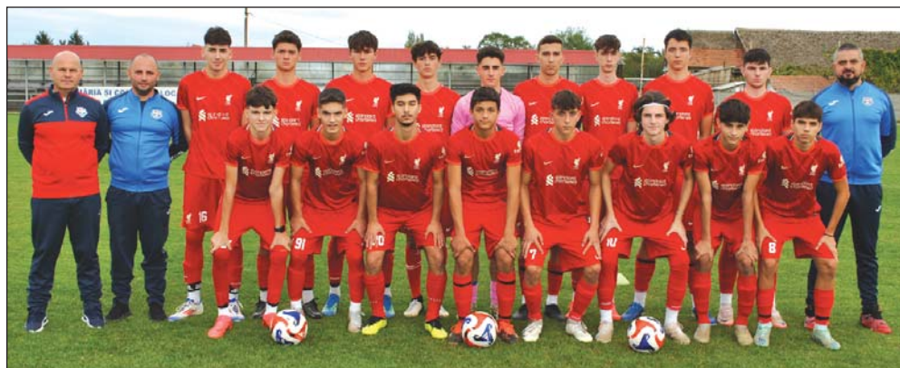
Ajungând să joace finala, Juniorii A1 au reușit o performanță remarcabilă

Pe fondul unui joc echilibrat, ce lăsa impresia că se va ajunge la loteria penalty-urilor, după o minge pierdută la mijlocul terenului, Steleac a pasat în adâncime, T. Ștefan a pus bine corpul în fața unui adversar și a marcat plasat: 2-1. Era minutul 85, iar