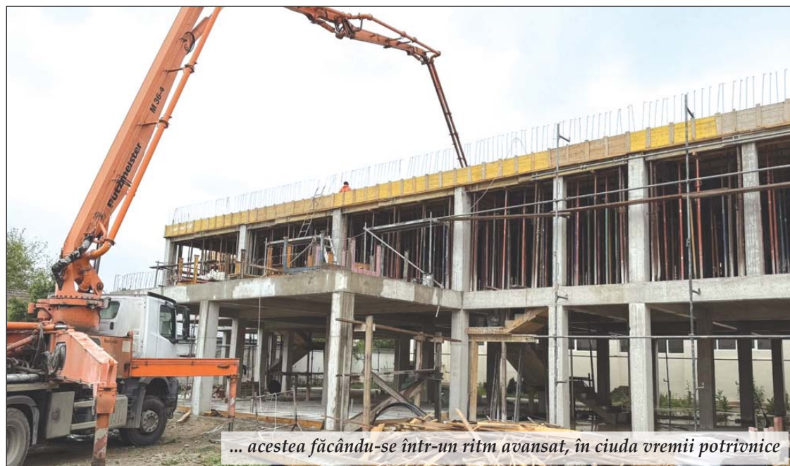
... acestea făcându-se într-un ritm avansat, în ciuda vremii potrivnice

Noua școală din Vladimirescu este o investiție în viitorul copiilor comunității – un semn clar că educația este o prioritate.