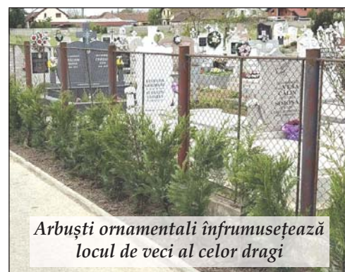
Arbuști ornamentali înfrumusețează locul de veci al celor dragi

Prin aceste măsuri, se dorește nu doar întreținerea corectă a cimitirelor, ci și cultivarea unei atitudini de respect față de cei plecați și față de memoria lor, așa cum se cuvine într-o comunitate unită și civilizată.