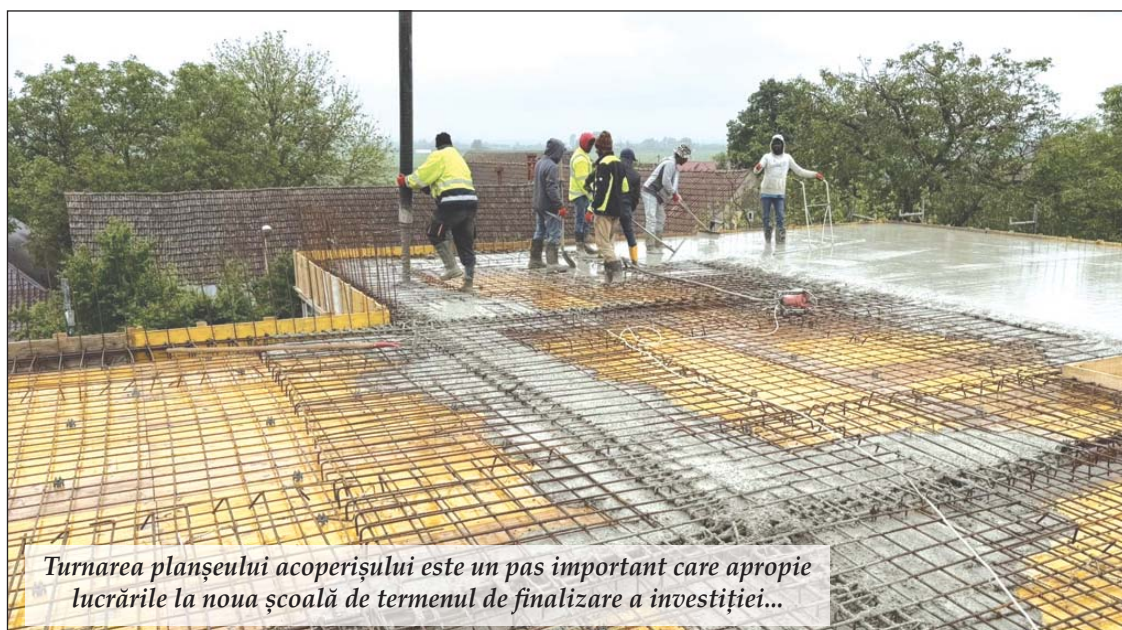
Turnarea planșeului acoperișului este un pas important care apropie lucrările la noua școală de termenul de finalizare a investiției...

Proiectul prevede șase săli de clasă, o sală de sport (dotată cu vestiare), săli de lectură, precum și cabinete dedicate cadrelor didactice. Suprafața totală a noii școli se apropie de 1.000