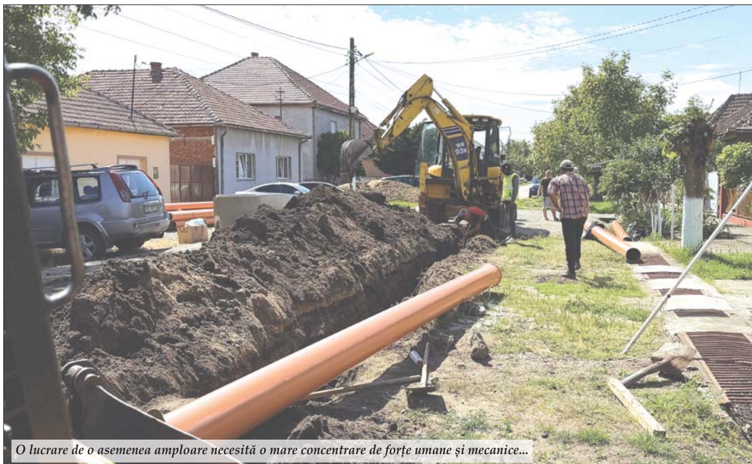
O lucrare de o asemenea amploare necesită o mare concentrare de forțe umane și mecanice...

Unul dintre cele mai importante proiecte de infrastructură din localitatea Horia prinde contur cu pași siguri: lucrările la rețeaua de canalizare sunt în plină desfășurare, echipele de muncitori fiind prezente zilnic pe teren, pe străzile localității.