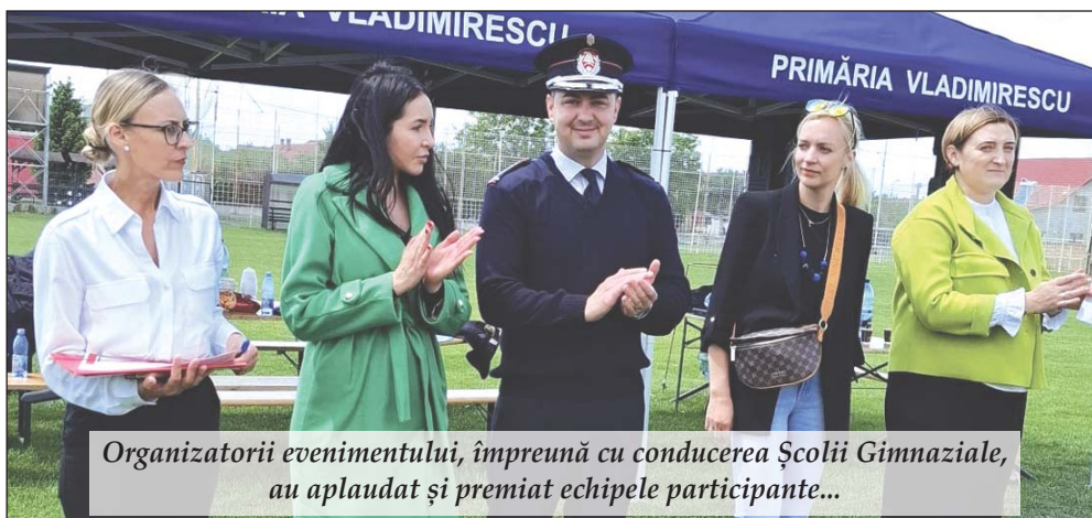
Organizatorii evenimentului, împreună cu conducerea Școlii Gimnaziale, au aplaudat și premiat echipele participante...

Felicitări tuturor elevilor și profesorilor coordonatori! Mulțumiri Primăriei Comunei și Școlii Gimnaziale Vladimirescu!