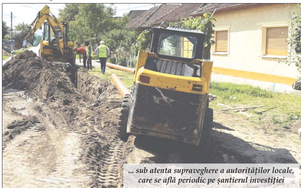
... sub atenta supraveghere a autorităților locale, care se află periodic pe șantierul investiției

cea ce privește igiena și confortul casnic, canalizarea modernă este un pas important și pentru protejarea mediului înconjurător și pentru dezvoltarea localității.