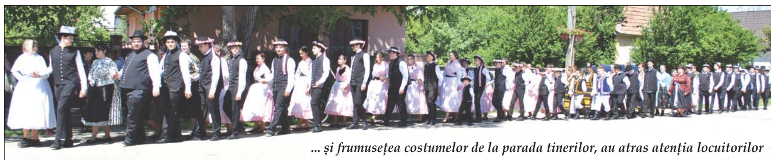
... și frumusețea costumelor de la parada tinerilor, au atras atenția locuitorilor