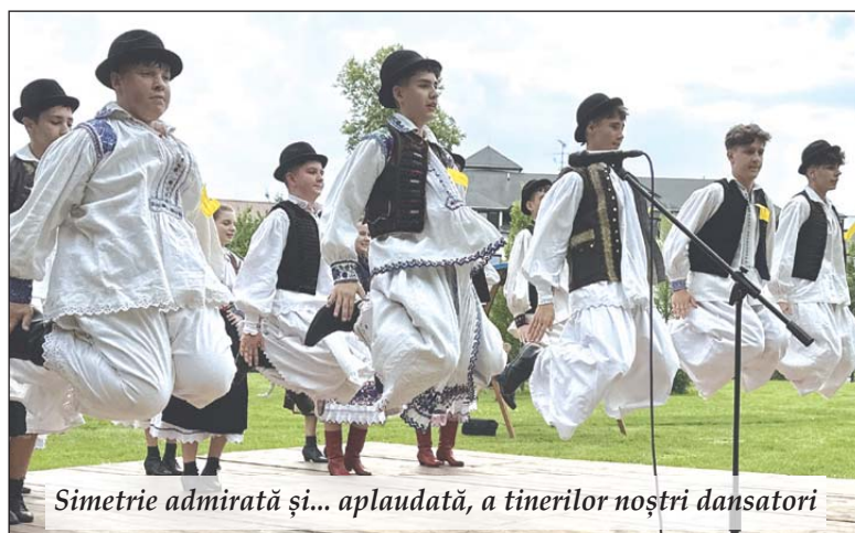
Simetrie admirată și... aplaudată, a tinerilor noștri dansatori