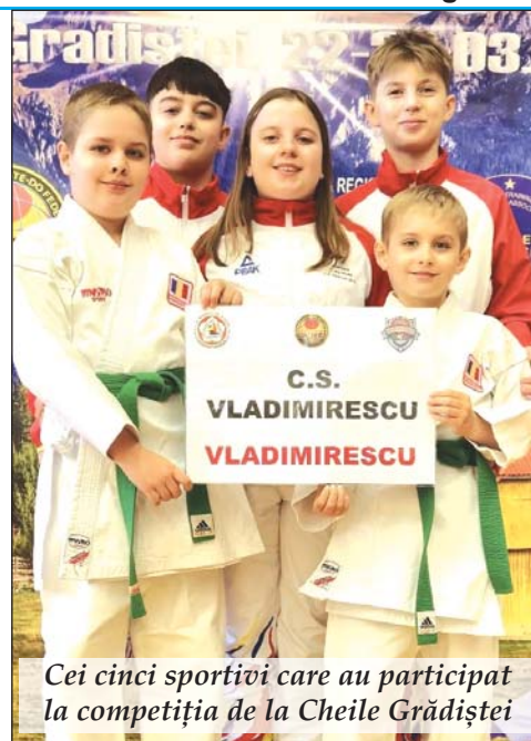
Cei cinci sportivi care au participat la competiția de la Cheile Grădiștei