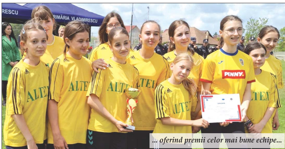
... oferind premii celor mai bune echipe...