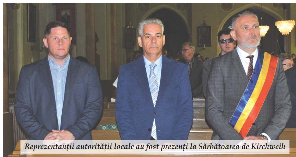
Reprezentanții autorității locale au fost prezenți la Sărbătoarea de Kirchweih