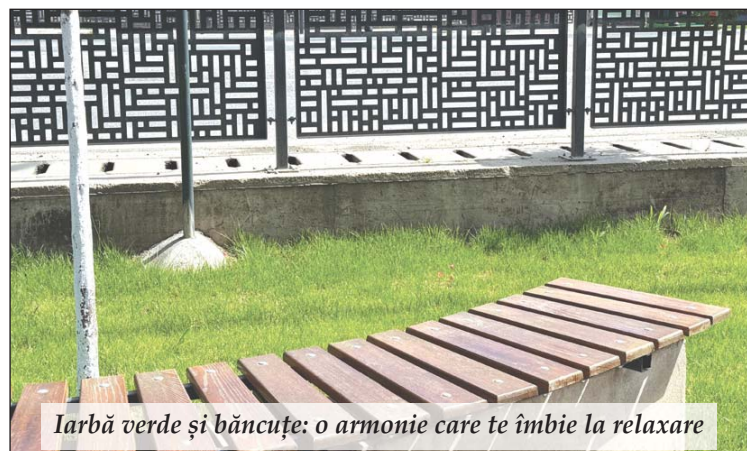
Iarbă verde și băncuțe: o armonie care te îmbie la relaxare

inestetici, a fost implementat un sistem modern de irigare subteran, întreaga zonă a fost pavată cu pavaje noi și durabile, oferind uniformitate și un aspect îngrijit, au fost montați stâlpi de iluminat arhitectural, care contribuie atât la siguranța, cât și la farmecul nocturn al locului, s-au adăugat băncuțe elegante, care invită la odihnă și socializare.