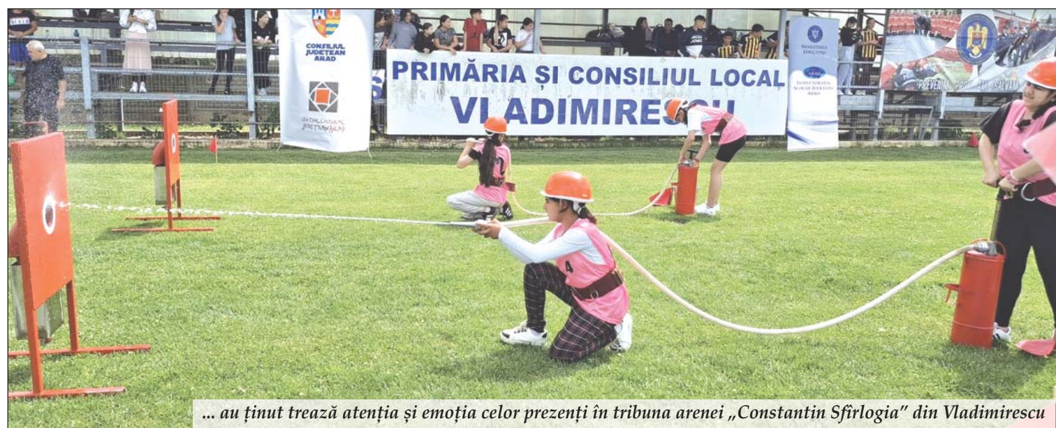
... au ținut trează atenția și emoția celor prezenți în tribuna arenei „Constantin Sfirlogia” din Vladimirescu