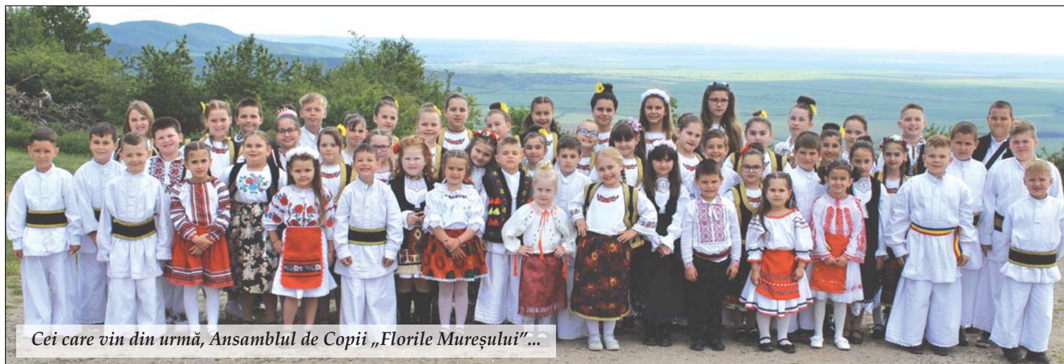
Cei care vin din urmă, Ansamblul de Copii „Florile Mureșului”...