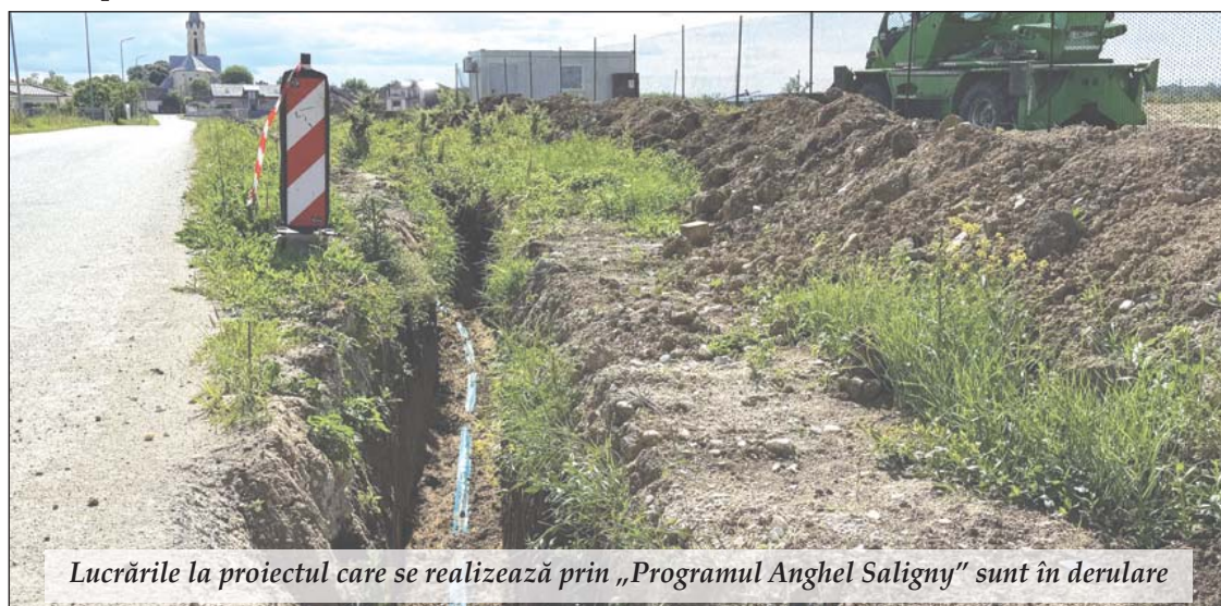
Lucrările la proiectul care se realizează prin „Programul Anghel Saligny” sunt în derulare

Cu fiecare metru de conductă instalat, Vladimirescu își consolidează statutul de comună în plină dezvoltare, orientată spre confortul cetățenilor și atragerea de noi oportunități economice.