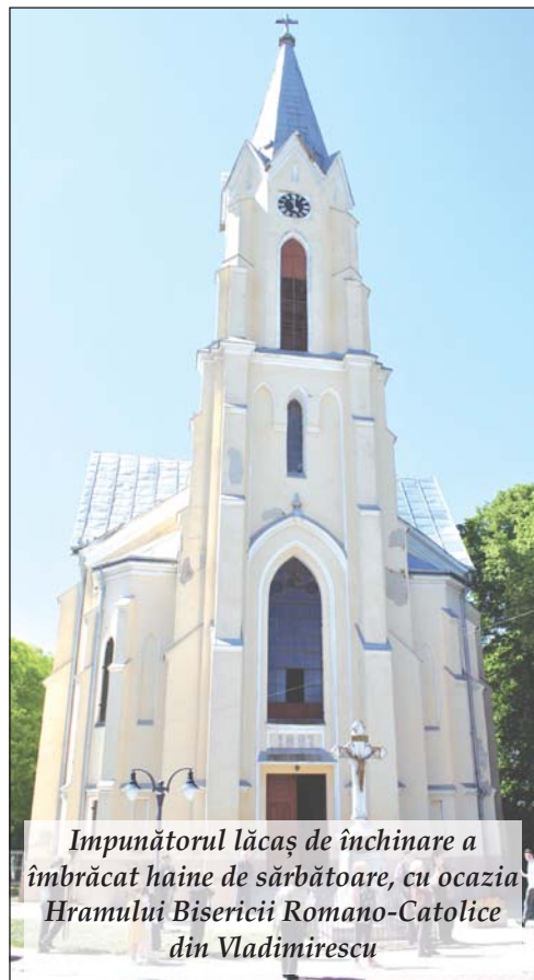
Impunătorul lăcaș de închinare a îmbrăcat haine de sărbătoare, cu ocazia Hramului Bisericii Romano-Catolice din Vladimirescu

În comuna Vladimirescu (Glogowatz), tradițiile nu se uită, ci se păstrează cu sfințenie și se duc mai departe din generație în generație. Așa s-a întâmplat și în acest an, când comunitatea a sărbătorit cu emoție și bucurie Kirchweih 2025, una dintre cele mai îndrăgite și longevive sărbători ale zonei, moștenită de la șvabii bănățeni care au trăit aici și care au clădit o cultură de neuitat.