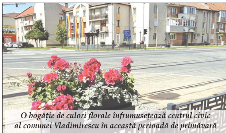
O bogăție de culori florale înfrumusețează centrul civic al comunei Vladimirescu în această perioadă de primăvară

De asemenea, toate rețelele electrice, de cablu și telecomunicații au fost introduse în subteran, eliminând vizual stâlpii