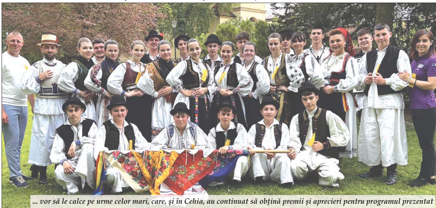
... vor să le calce pe urme celor mari, care, și în Cehia, au continuat să obțină premii și aprecieri pentru programul prezentat