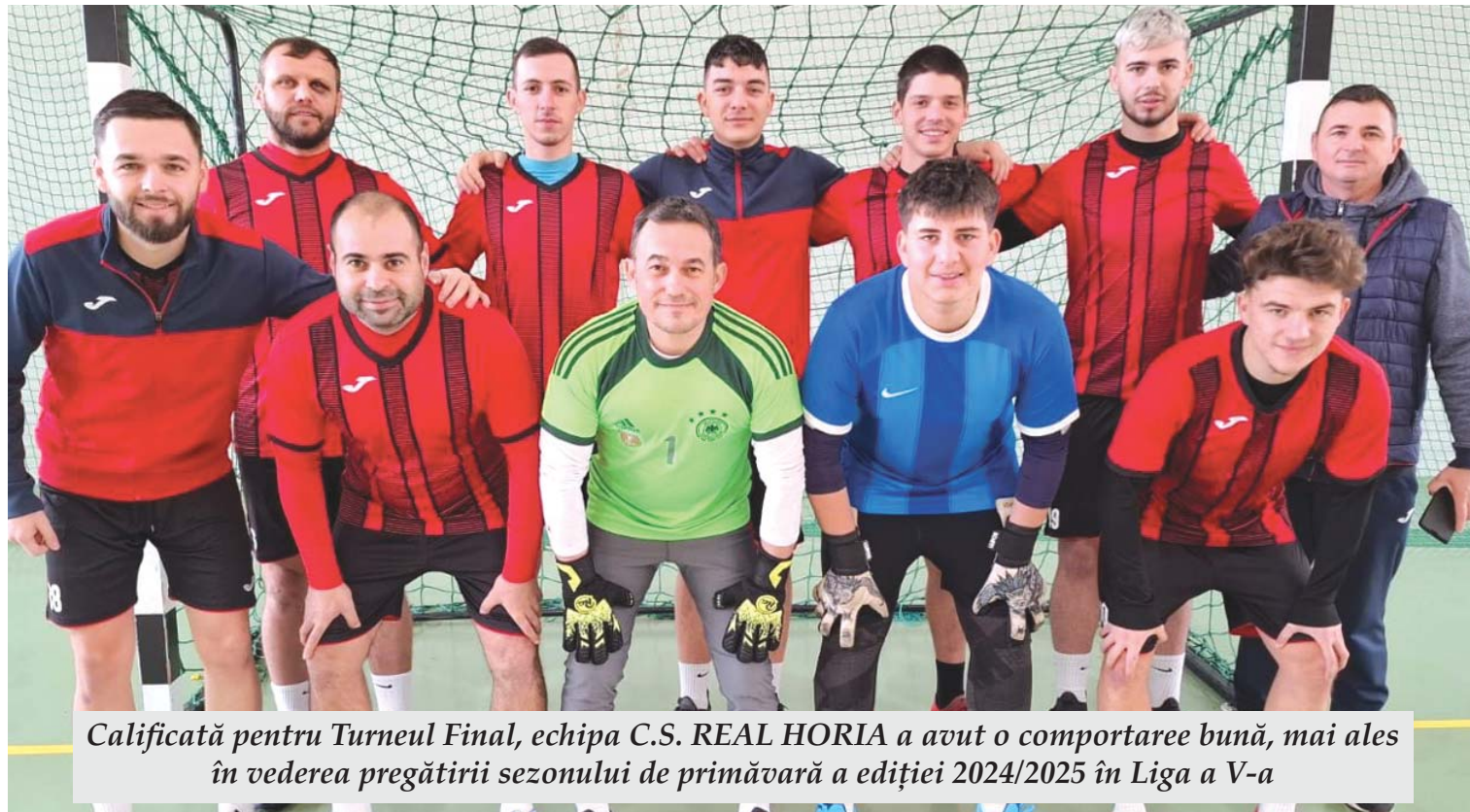
Calificată pentru Turneul Final, echipa C.S. REAL HORIA a avut o comportare bună, mai ales în vederea pregătirii sezonului de primăvară a ediției 2024/2025 în Liga a V-a