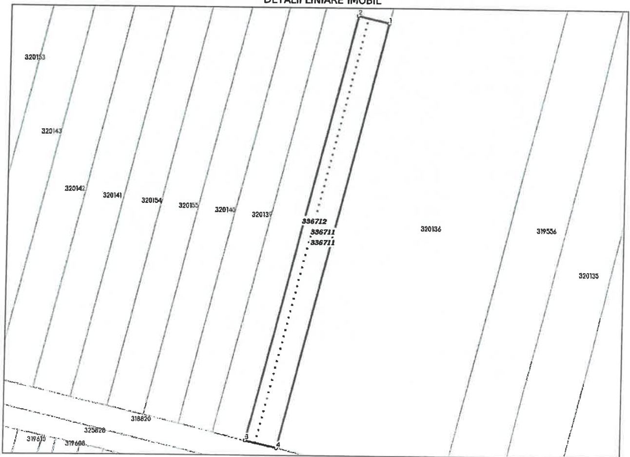
DETALII LINIARE IMOBIL

* Suprafața este determinată în planul de proiecție Stereo 70.