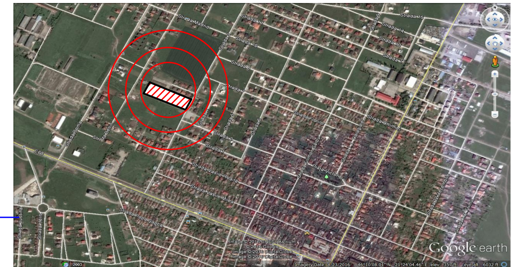
INCADRARE IN ZONA