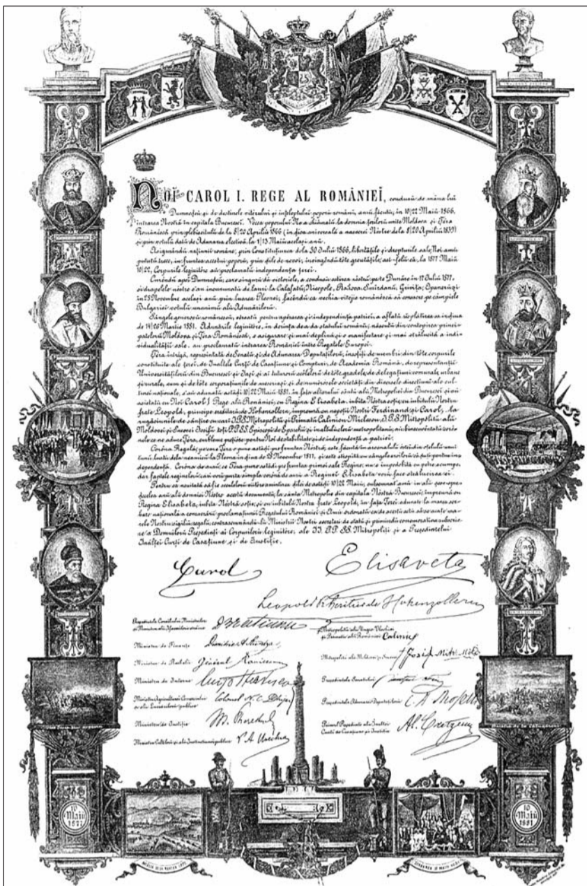
Actul de proclamare al Regatului României, în anul 1866

Banatul, Transilvania, Basarabia și Bucovina s-au unit cu Regatul României după Primul Război Mondial (1914-1917). După cel de-al Doilea Război Mondial și ocul-