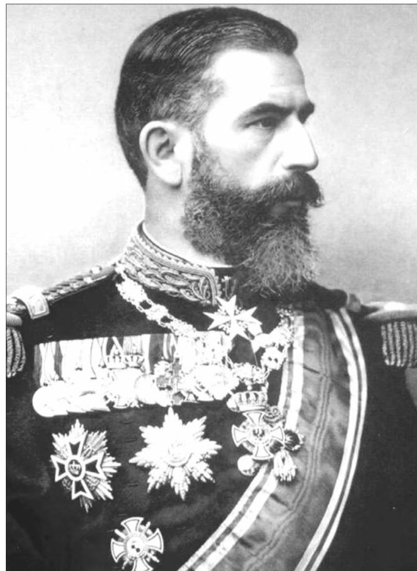
Regele Carol I de România

Regatul României a fost recunoscut ca stat independent în urma Războiului de Independență (1877-1878). În anul 1878, domnitorul Carol I de Hohenzolern a primit titlul