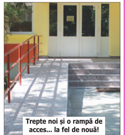
Trepte noi și o rampă de acces... la fel de nouă!

să-și primească elevii! Nu ne lăudăm, dar lășăm imaginile să vorbească. Cred că am satisfăcut pretențiile tuturor: dascăli, elevi, părinți. Mai este câte ceva, dar cu ajutorul sugestiilor Dumneavoastră, a tuturor, se rezolvă. Marile lucrări, cu mari eforturi financiare, au am trecut. Acum ne ocupăm de finisaje. Iar la acest capitol, venim cu noua intrare la Școala Gimnazială Vladimirescu, unde au fost refăcute complet, atât treptele de intrare, cât și rampa de acces pentru persoanele cu dizabilități.