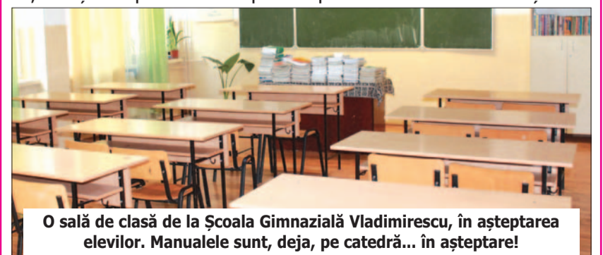
O sală de clasă de la Școala Gimnazială Vladimirescu, în așteptarea elevilor. Manualele sunt, deja, pe catedră... în așteptare!