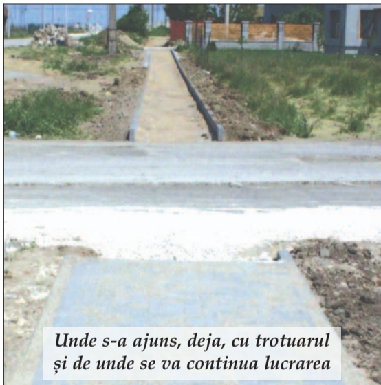
Unde s-a ajuns, deja, cu trotuarul și de unde se va continua lucrarea