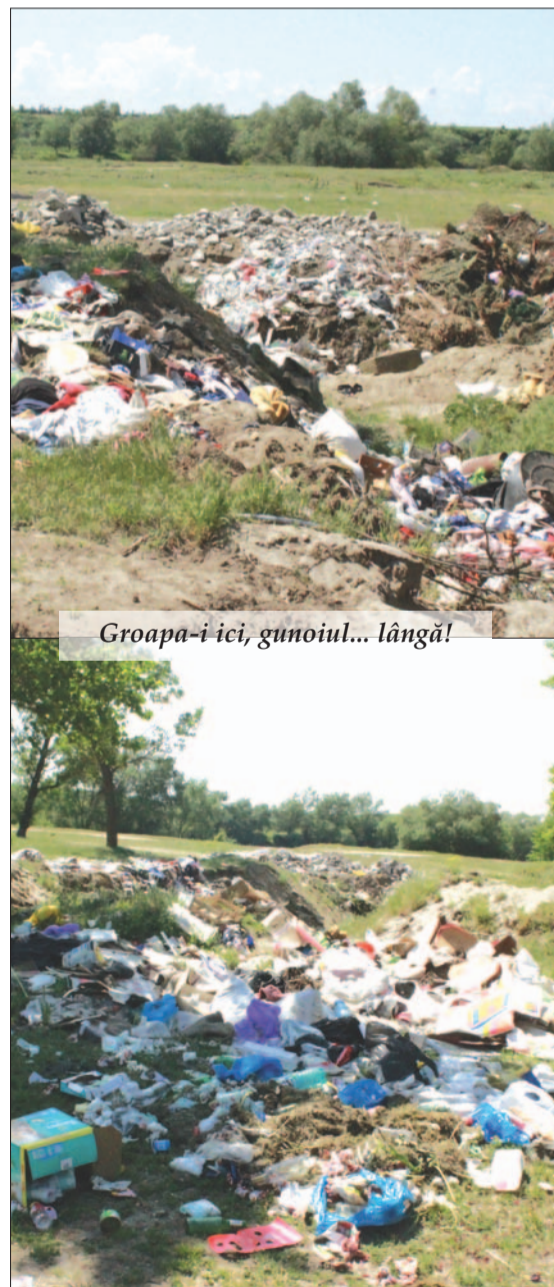
Groapa-i aici, gunoiul... lângă!

* Da, avem această groapă de împrumut , în care depozitam aceste materiale și în care aprobăm la toți cetățenii depozitarea. Primăria le împinge și apoi le acoperă, pentru a fi curat. Decât să aruncați oriunde, mai bine solicitați-ne sprijinul. Vi-l dăm. Dar priviți una din pozele redată aici. Așa a rămas după o zi la pădure. La aer curat. Dar dacă nu ducem aceste resturi menajere la tomberoanele existente, vântul, câinii și nu numai acestea, nu iartă. Duminica viitoare nu mai avem loc pe iarbă.