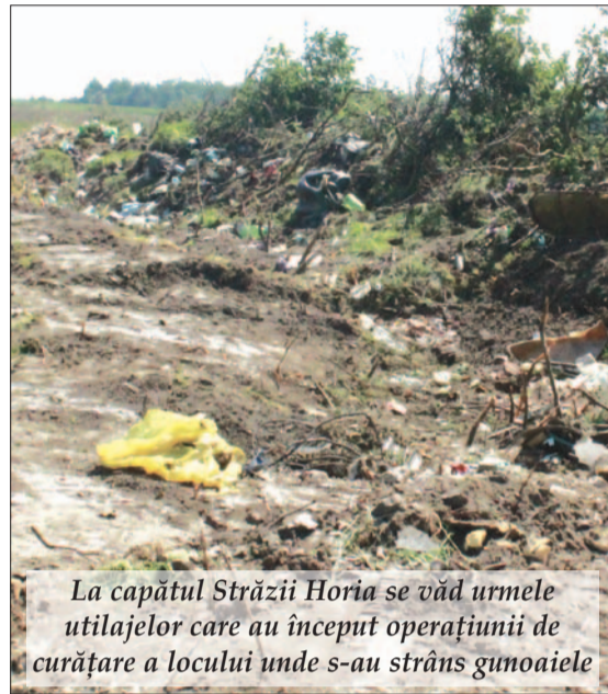
La capătul Străzii Horia se văd urmele utilajelor care au început operațiunii de curățare a locului unde s-au strâns gunoaietele

dar împământente în obiceiurile noastre, și care nu ne putem mândri. De exemplu: numai de pe Strada Horia, de la fosta groapă (denumită Pirițoiaie) am cărat sute de tone.