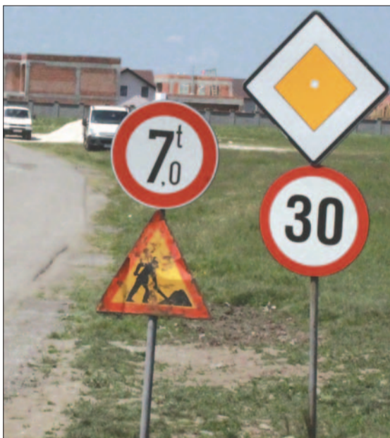
Indicatoarele de limitare a vitezei și tonajului, montate la intrarea dinspre Strada Gării. Se vede și indicatorul care semnaleză că drumul este în lucrare

* Stimați cetățeni, locuitori ai Străzilor 16 și 17 din Cartierul Glogovăț, care ați fost la primar în legătură cu Strada 15. Am spus-o și repet (dacă trebuie și de 100 de ori!): NU! STRADA 15 NU SE LĂRGEȘTE PENTRU CIRCULAȚIA TIR-urilor! Este o stradă principală, care face legătura dintre Strada 3 și Strada Gării. M-am ținut de cuvânt. Priviți pozele cu indicatoarele de circulație. Acestea sunt plantate la intrarea dinspre strada Gării, la mijloc și la ieșirea în Strada 3. Și în sens invers. Limită de viteză plus limită de tonaj.