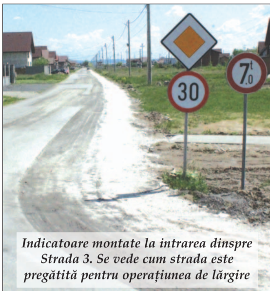
Indicatoare montate la intrarea dinspre Strada 3. Se vede cum strada este pregătită pentru operațiunea de lărgire