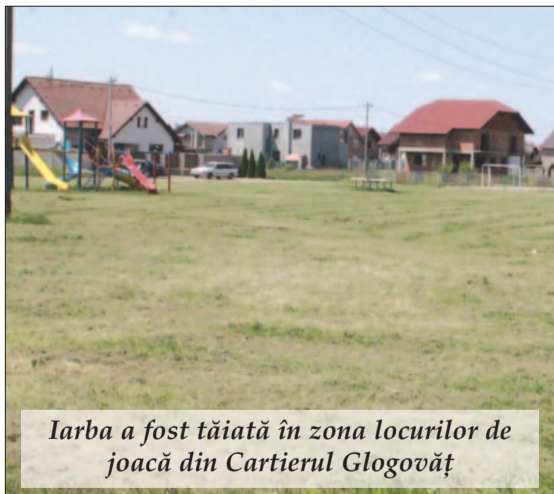
Iarba a fost tăiată în zona locurilor de joacă din Cartierul Glogovăț

* Am continuat cositul ierbii din parcurile în devenire din Cartierul Glogovăț, pe lângă pista de biciclete și accesul la cimitire. Toate aceste lucrări s-au realizat cu utilajele noastre.