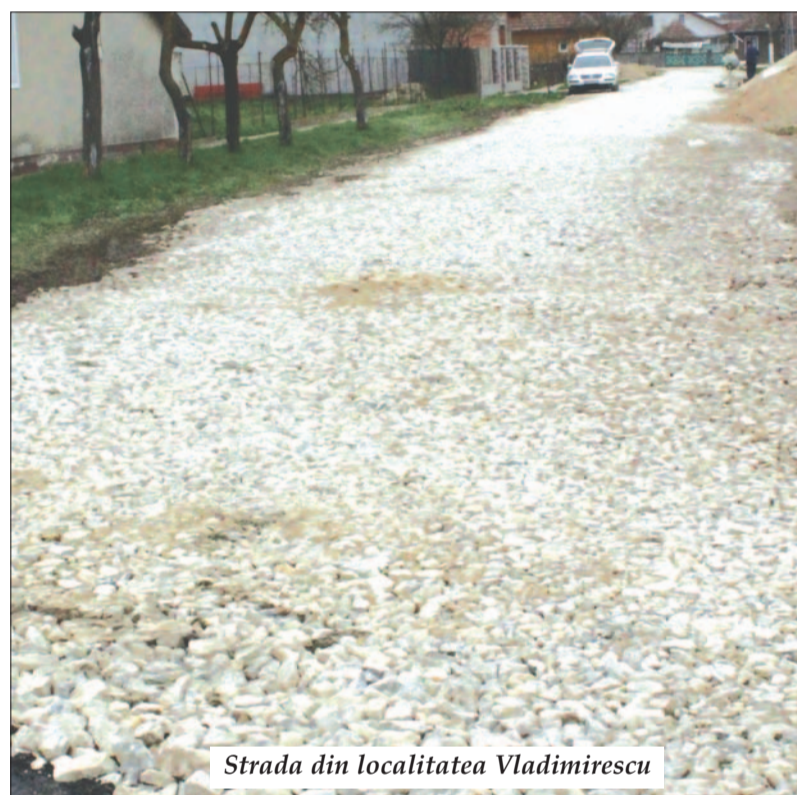
Strada din localitatea Vladimirescu