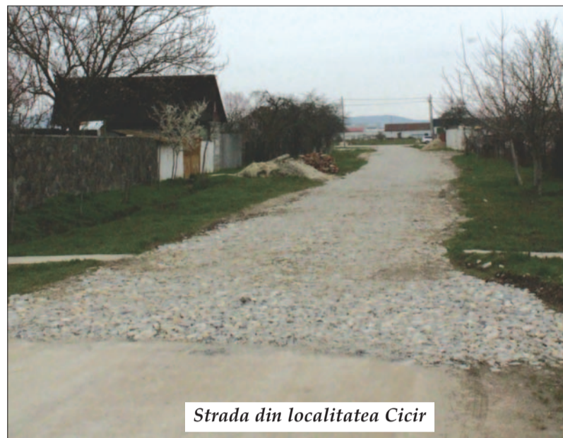
Strada din localitatea Cicir

* Și încă două străzi , una din Vladimirescu, iar cealaltă din Cicir, care, până nu demult, nu erau locuite, le-am pietruit. Stimați locatari, știu că doriți și asfalt. De acord, vă înțeleg, numai să se mai taseze pietruirea.